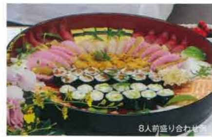
寿司盛り合わせ (1人前) 1,500円~