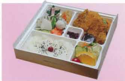
特選黒豚ロースカツ弁当 1,100円