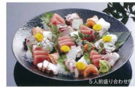
刺身盛り (1人前) 1,500円~