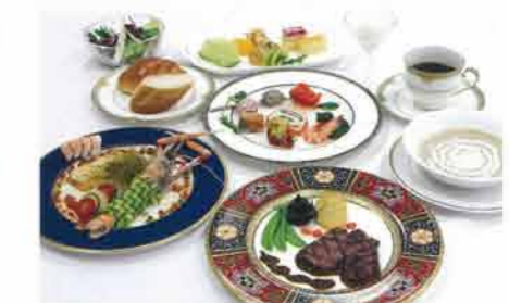
ディナーコース 8,000円~