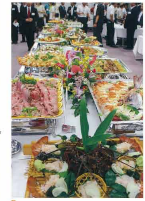
オードブル (1人前) 3,000円~