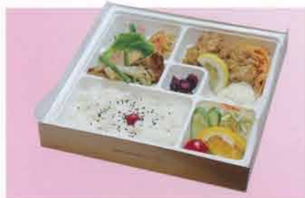
チキン南蛮弁当 1,100円