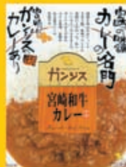
ガンスカレー 550円 (1食入り)