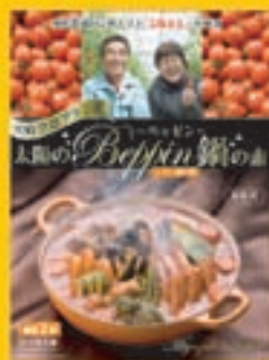
太陽のべっぴん鍋の素 720円 (300g, 3~4人前)