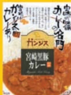
ガンスカレー 550円 (1食入り)