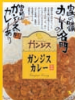
ガンスカレー 550円 (1食入り)