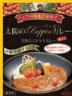
太陽のべっぴんカレー 620円 (1食入り)