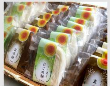
TinkTink OPEN 9 16 18