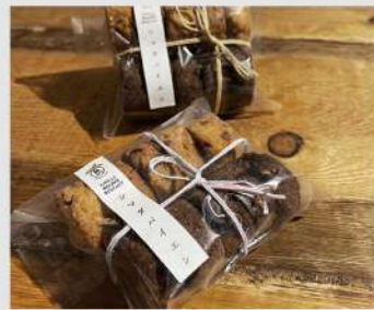
島田梅園 OPEN 17