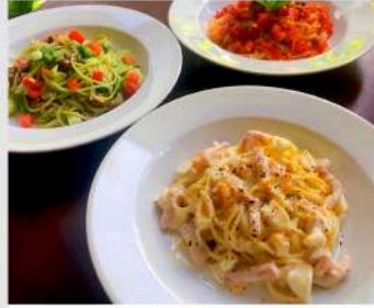
KANAYA OPEN 9 16 18