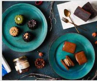
BLUE OWL OPEN 9 10