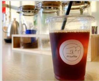
N coffee OPEN 10 17