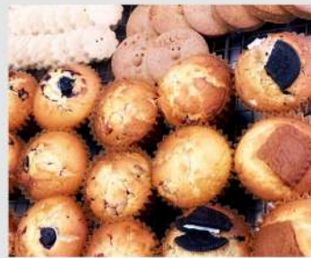
おひさま商店 OPEN 10