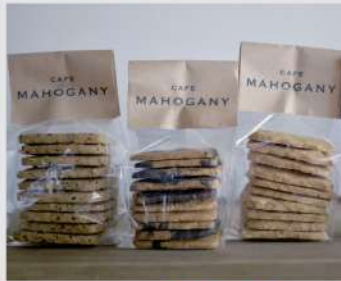
CAFE MAHOGANY OPEN 17 18