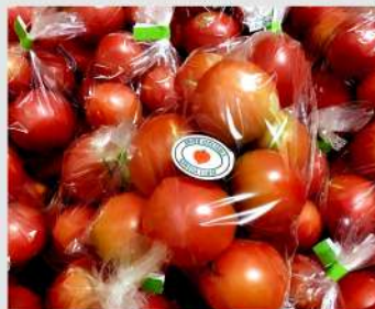
SAKURA FARM OPEN 11 12 13