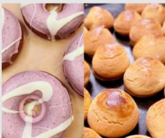
ちかつーセレクション OPEN 13