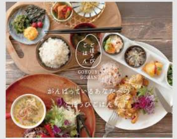
DANBO*DELI OPEN 10 16 17 18