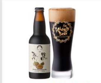
HidejiBeer OPEN 11 12 13