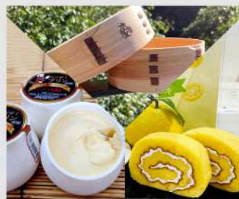
道の駅セレクション OPEN 11 12