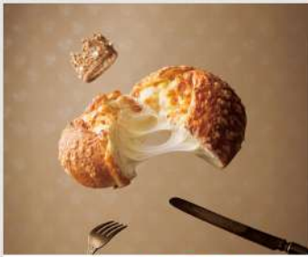
Heart Bread ANTIQUE OPEN 9 10