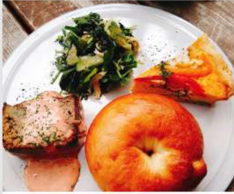
BAKERY gram OPEN 10