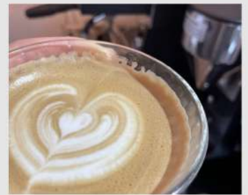
ジュクルパコヒー OPEN 13