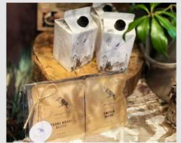
カワセミコヒー OPEN 9 16