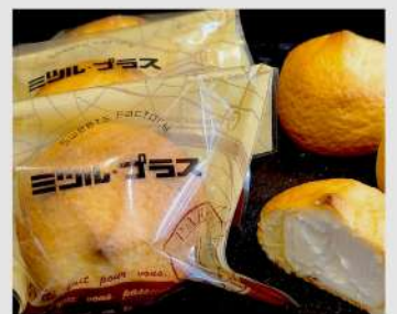
ミツルプラス OPEN 14 15-16-17 18