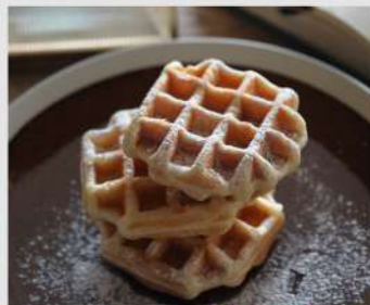
STAIRS OF THE SEA OPEN 9 10