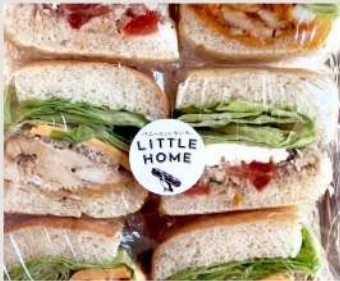
LITTLE HOME OPEN 17 18