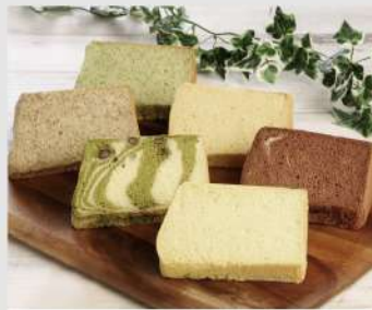
酒巻スイーツキッチン OPEN 16 17 18