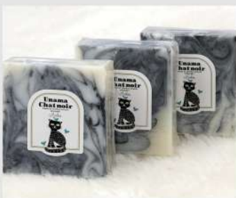
美郷町 日向備長炭 OPEN 11 12 13 16