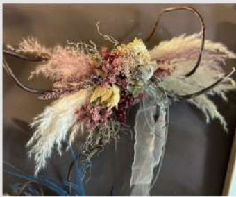
アトリエマキ OPEN 9 16