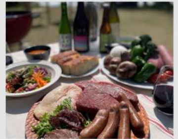
New Day OPEN 9 10