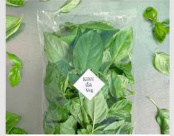
KIKU da Veg OPEN 13