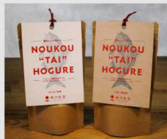
日々とデザイン OPEN 13