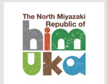
ひむか共和国 OPEN 14 15