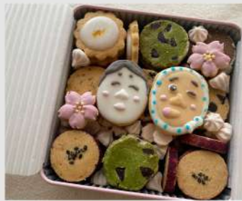
おやつ工房 あのね。 OPEN 9