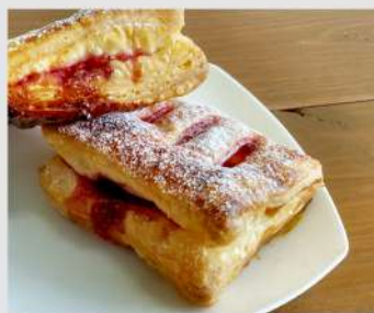
みさとなパイ OPEN 17 18