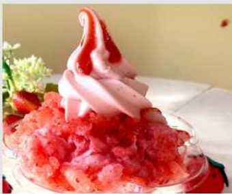
川原いちご農園 OPEN 14 15-16-17 18