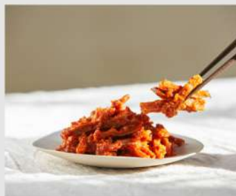
延岡メンマ OPEN 11 12 13