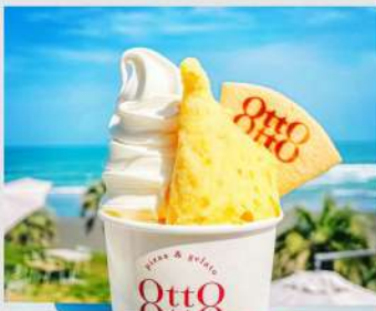
OttoOtto OPEN 9 10