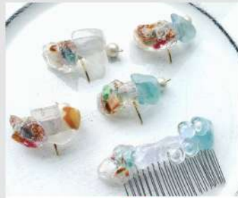
CHAWA OPEN 10